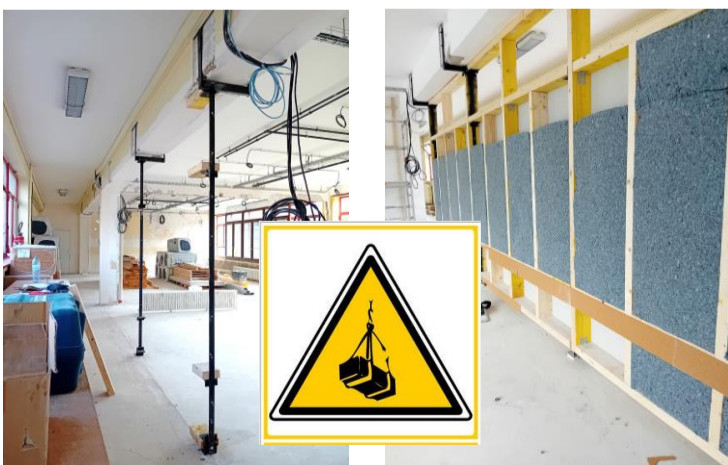
Cloison ossature bois au RDC