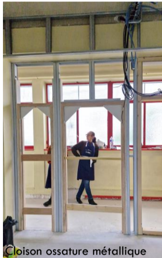
Cloison ossature métallique