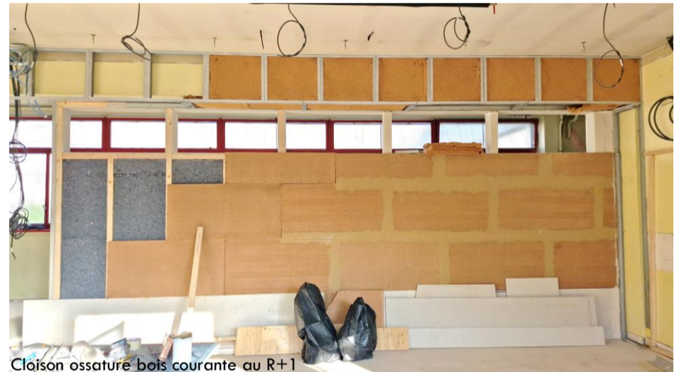
Cloison ossature bois courante au R+1